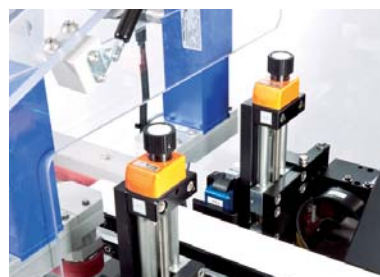
Alle onderdelen zijn afstelbaar voor maximale flexibiliteit