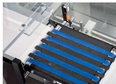
Uitermate gevoelig weegplatform