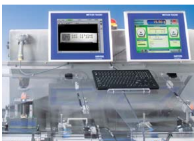
Gebbruiksvriendelijk interface voor snelle productwisselingen

Optimaal afdrukken van een unieke reeks cijfers of DataMatrix-barcodes om te voldoen aan de huidige en toekomstige wettelijke vereisten.