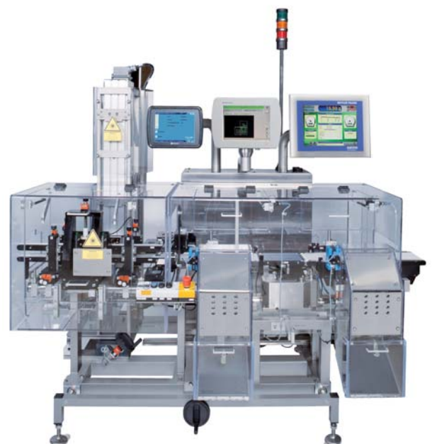
XS2 MV met lasermarkeringssysteem