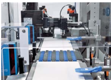
Betere kwaliteitscontrole met meerdere uitwerpstations